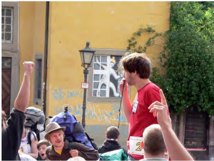
Auf die Plätze, fertig, los: Startschuss zum Trammerrennen 2011 in Freiburg i.B.

Wasser, Essen, Papier und Edding – wer hätte gedacht, dass man schon mit so einer geringen Ausrüstung an einer Meisterschaft teilnehmen kann? Bei dieser Meisterschaft geht's: Am 25. Mai 2012 startet in Braunschweig nämlich das 5. deutschen Trammerrennen . Und Kristin wird mit genau diesen Dingen an den Start gehen und gegen – oder besser gesagt gemeinsam mit – 7 Teams und 26 Einzelpersonen* antreten. Bis zum 28. Mai werden Zweiertams versuchen, als erstes das Ziel – das derzeit noch unbekannt ist – zu erreichen. Einzige Bedingung: Autostoppend muss es sein!