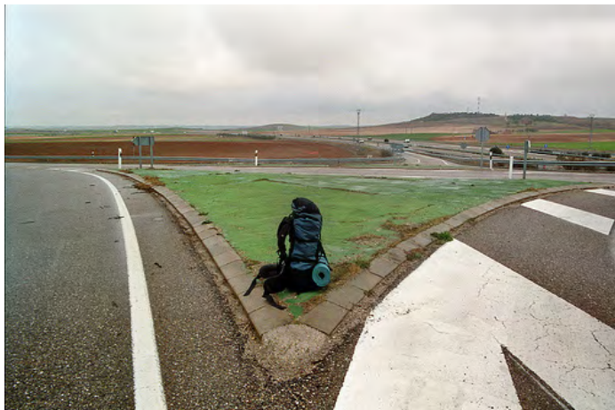
Wo geht's lang? Wie geht's weiter?